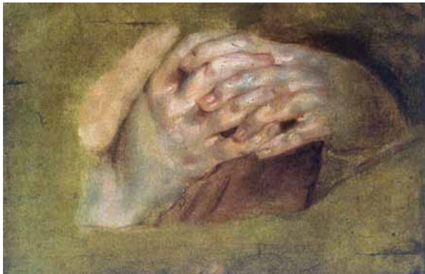
De traditioneel-gereformeerde benadering: het Woord en het gelovige gebed zijn voldoende voor het doven van de pijlen van de boze. (schilderij van Peter Paul Rubens)

onware aannames en overtuigingen over God, mens en wereld. Het is de combinatie van Woord en Geest die christenen moet beschermen tegen wereldse denkpatronen (en tegen dwaalleringen).