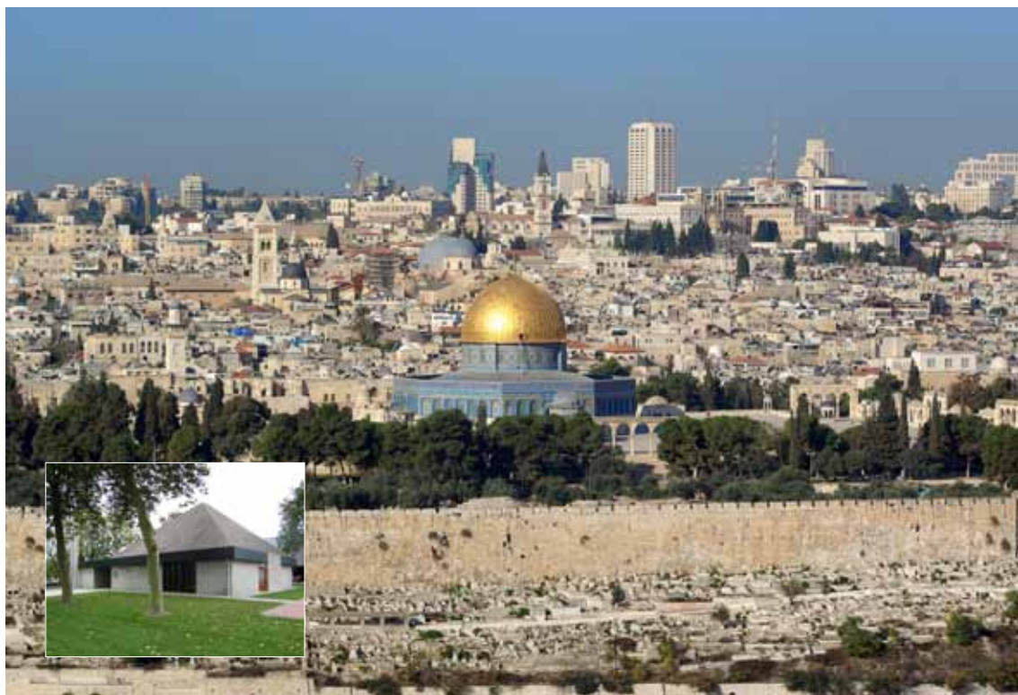
Aanpassen in: Jeruzalem. Inzetje: de Jeruzalemkerk in Urk.

Het bevreemdt de Jeruzalemkerk, zoals de NGK Urk heet, dat er ‘binnen onze kerken weinig aandacht is voor Israël en de huidige situatie in het Midden-Oosten’. In andere kerkgenootschappen ligt dat anders. Zo spreekt de PKN in haar kerkorde uit ‘dat zij geroepen is gestalte te geven aan haar onopgeefbare verbondenheid met het volk Israël en kent de CGK een lange traditie van verbondenheid met Israël. Die komt onder meer tot uiting in een deputaatschap Kerk en Israël, participatie in het Centrum Israël Studies en het uitzenden van een predikant als Israël-consulent naar Israël. In de GKv krijgt de verbondenheid met Israël en het