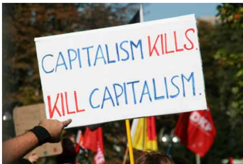
De (post)moderne benadering: geestelijke strijd betekent bovenal het tegengaan van destructieve machten, machtsstructuren en ideologieën in de wereld, zoals het ongebreidelde kapitalisme, en het jezelf inzetten voor vrede en gerechtigheid.