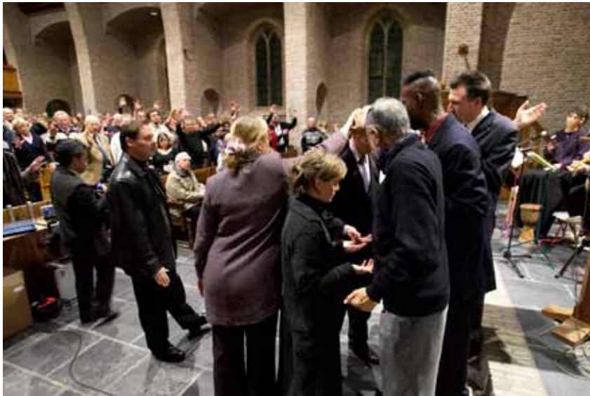
Ervaringen met kwade machten én de mogelijkheid van bevrijding in de naam van Jezus Christus zijn in Nederland zeldzaam vergeleken met kerken op het zuidelijk halfrond.