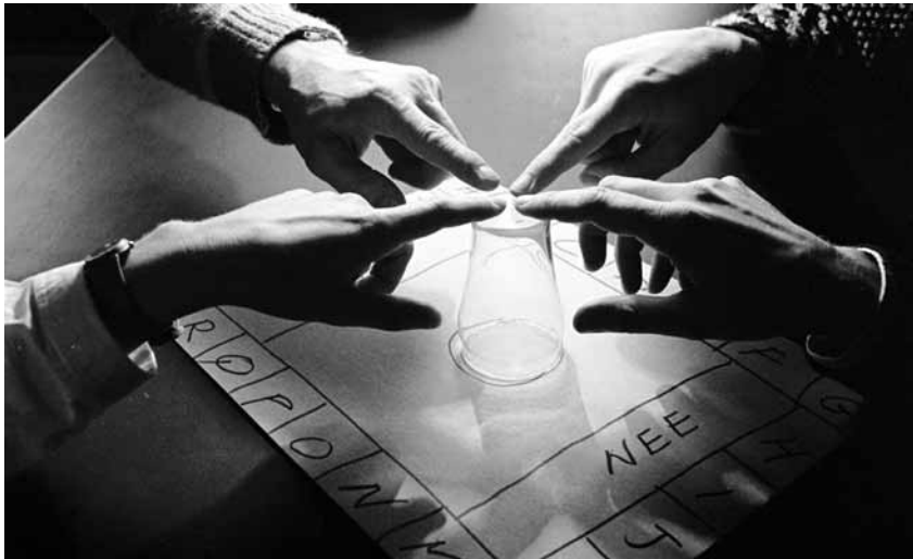
Gevolgen van demonische gebondenheid komen we vooral tegen bij mensen die met vormen van occultisme in aanraking zijn gekomen – iets wat helaas steeds meer gebeurt, naarmate het proces van ontkerkelijking en ontkerstening voortschrijdt.

thought (2010) van John Thomas. De overgrote meerderheid van nieuwtestamentische verwijzingen naar ziekte geeft geen indicatie van de oorzaak ervan. Soms is dit wel het geval, bijvoorbeeld als er sprake is van een zonde. Er wordt meestal niet bij vermeld om wat voor zonde het gaat, al is het opvallend hoe vaak er – indirect – wordt gewaarschuwd voor een gebrek aan vergevingsgezindheid (zie bijvoorbeeld Matteüs 6:12, Lucas 17:3 en 2 Korintiërs 2:10-11). Hoe dit ook zij, zonde leidt niet automatisch tot ziekte. En al is het voor ons moeilijk te doorgronden, soms is het God zelf die wegens zonden een bepaalde ziekte zendt (1 Korintiërs 11:30-32) of nog erger (Ananias en zijn vrouw vielen dood neer, Handelingen 5). Denk ook aan de waarschuwing van Jezus in Johannes 5:14, NBV: ‘U bent nu gezond; zondig daarom niet meer, anders zal u iets ergers overkomen.’ Of aan het belang van schuldbelijdenis, zoals we dit tegenkomen in Jakobus 5:16, NBV: ‘Beken elkaar uw zonden en bid voor elkaar, dan zult u genezen.’ Heel belangrijk in dit verband is de rol van geestelijk onderscheidingsvermogen, om te kunnen onderkennen wat er precies aan de hand is.