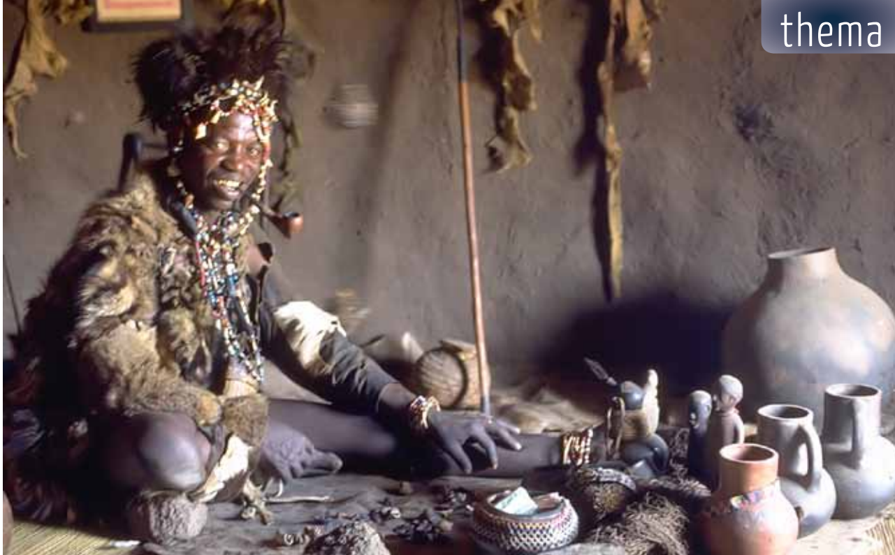
In Grace Church leert de ervaring dat vrijwel iedere Afrikaanse broeder of zuster in ons midden in meer of mindere mate te maken heeft – of heeft gehad – met 'witchcraft' of demonische belasting, bijvoorbeeld via zogeheten 'witch doctors' (foto)

kend artikel over de opkomst van de charismatische kerken in Ghana ( Charismatic Churches in Ghana and Contextualization ). De geestelijke machten worden immers wel degelijk ervaren in het dagelijkse leven. Van de nieuwe, christelijke religie werd en wordt verwacht dat ze niet machteloos staat in die geestelijke strijd, maar actief bevrijding en bescherming biedt. De passieve opstelling van de zendingkerken, en de afwezigheid van een bediening van bevrijding en genezing, werkte in de hand dat Afrikanen het christelijke geloof lang zijn blijven zien als een vreemde, westerse religie, die geen antwoorden had op hun levensvragen. Het christelijke geloof bleef een 'extra' – baat het niet dan schaadt het niet – maar voor de werkelijke vragen en noden bleven Afrikaanse bekeerlingen terugvallen op pre-christelijke oplossingen. De passiviteit van de zendingkerken had, in de postkoloniale tijd, ook de opkomst van de zogeheten African Initiated Churches (AIC's) tot gevolg: kerken die wél wortelden in de Afrikaanse belevingswereld, maar veelal doorschoten in syncretisme, met genezings- en bevrijdingsrituelen die sterk vermengd waren met de pre-christelijke religies. Omenyo analyseert hoe de westerse zending serieus werk maakte van de eerste drie niveaus van contextualisatie – gedrag, waarden en overtuigingen –