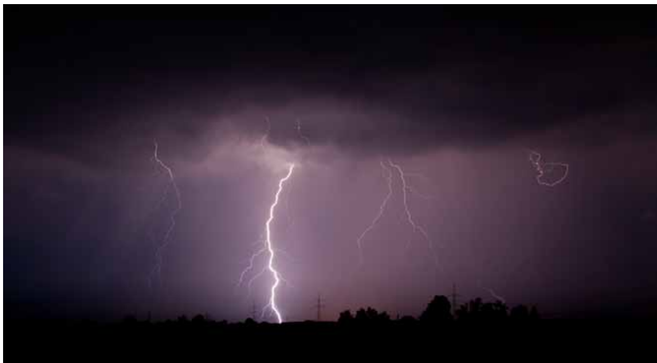
De charismatische benadering: er is een kosmisch conflict gaande tussen God en de machten van het kwaad.